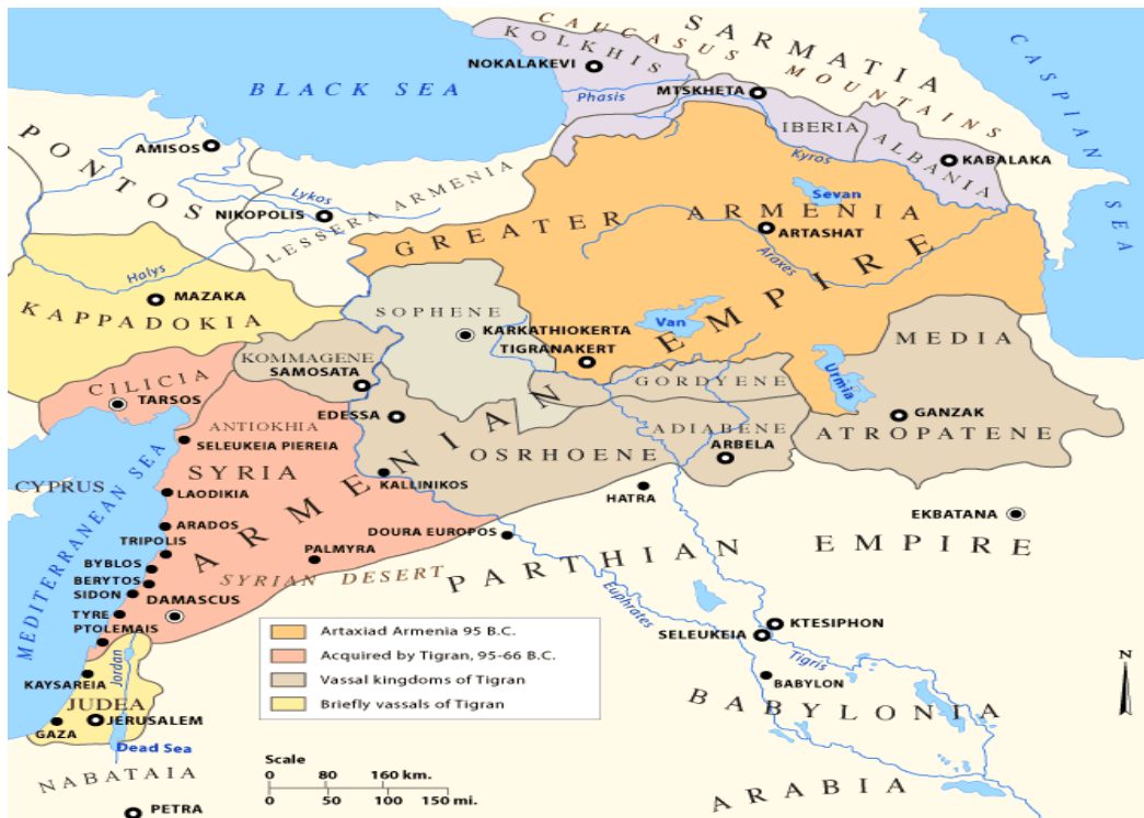
Figura 1. El Reino de Armenia

El conflicto en la región de Nagorno Karabaj tiene componentes milenarios. El registro más antiguo del nombre “Armenia” viene del siglo VI A.C. con un reino armenio que comenzó alrededor del 585 A.C., reivindicando su independencia, luego de las invasiones perpetradas por Alejandro Magno hacia el 330 A.C. que debilitaran los poderes regionales. Durante el siglo I A.C., la mayoría de los renombrados reyes armenios, como Tigran el Grande (Tigranes), gobernaron un imperio que se extendía desde los mares Caspio hasta el Negro considerando el Mediterráneo, haciéndole sombra a Roma y Partia en el Oriente Próximo durante un par de décadas (Hecho 11).