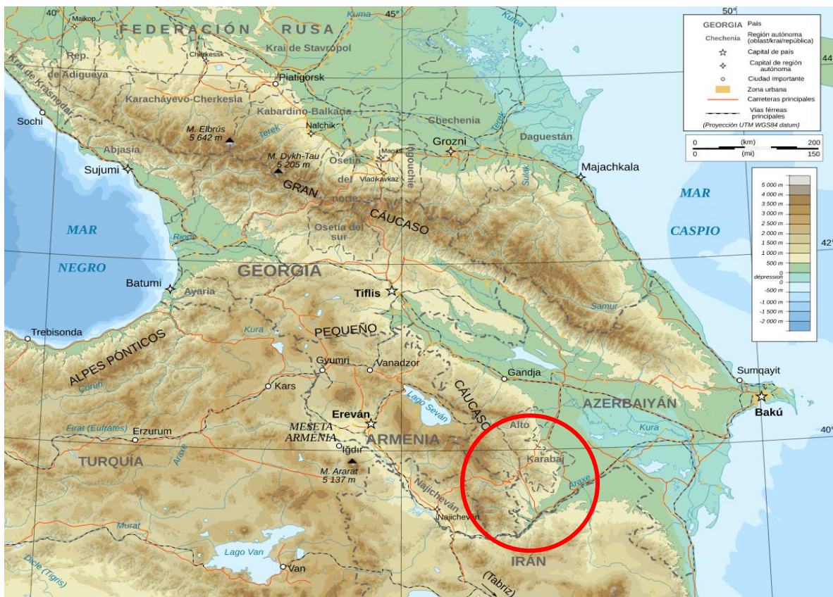
Figura 2. Mapa del Escenario

La ubicación geográfica del conflicto (Figura 2), se encuentra entre las montañas del Cáucaso Menor en el oeste y las estepas entre los ríos Kura y Aras en el este, con el territorio en disputa en el centro de la región en su conjunto.