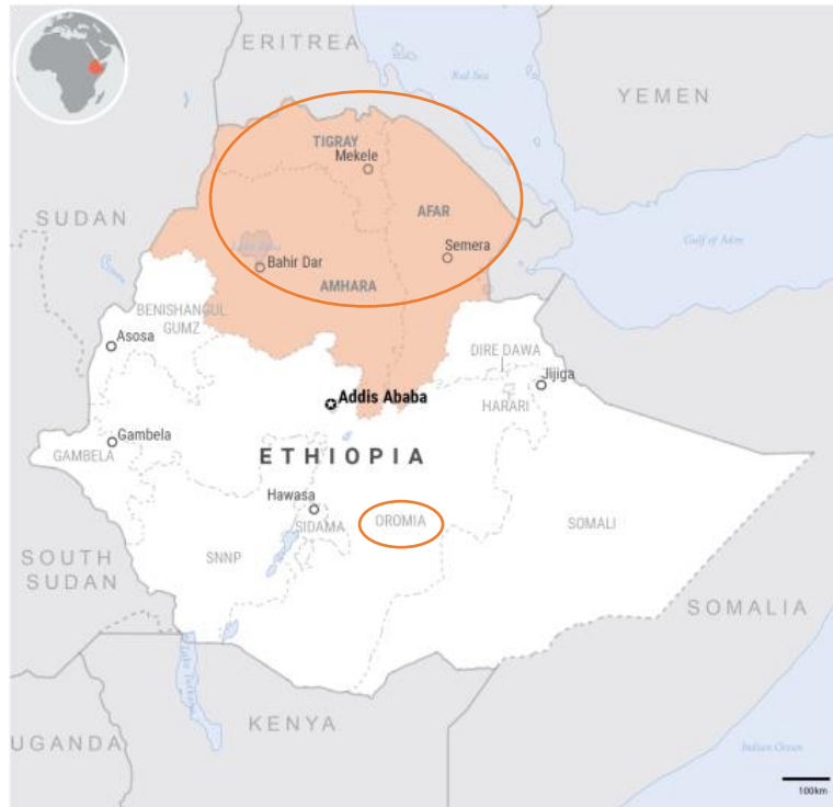
Figura 1 Mapa de Etiopía