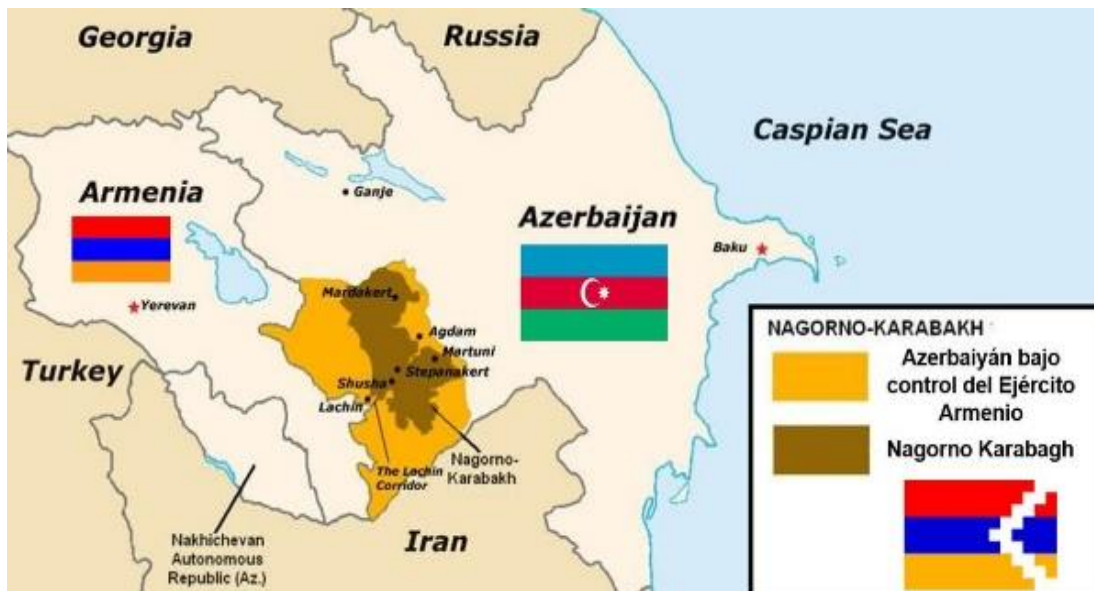
Fig. 3 Mapa de ubicación