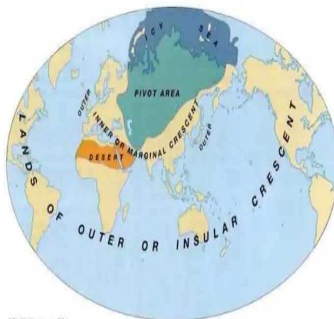
Fig. 2 Teoría de Mackinder

El espacio geopolítico que ocupa Rusia está sometido a diversas presiones que provienen de la doble característica de ser una ruta de paso, y el centro del poder terrestre, de acuerdo a la teoría del pivote geográfico de Mackinder; teoría que hoy se mantiene activa y se comprueba por la actividad derivada de la presión geopolítica ejercida por la nueva Ruta de la Seda, las implicancias que ha alcanzado la guerra entre Rusia y Ucrania y la convergencia en este espacio geográfico de intereses mayoritariamente contrapuestos de diversos actores, como la OTAN, la EU, Turquía, los Estados Unidos, la República Popular China, solo por nombrar algunos.