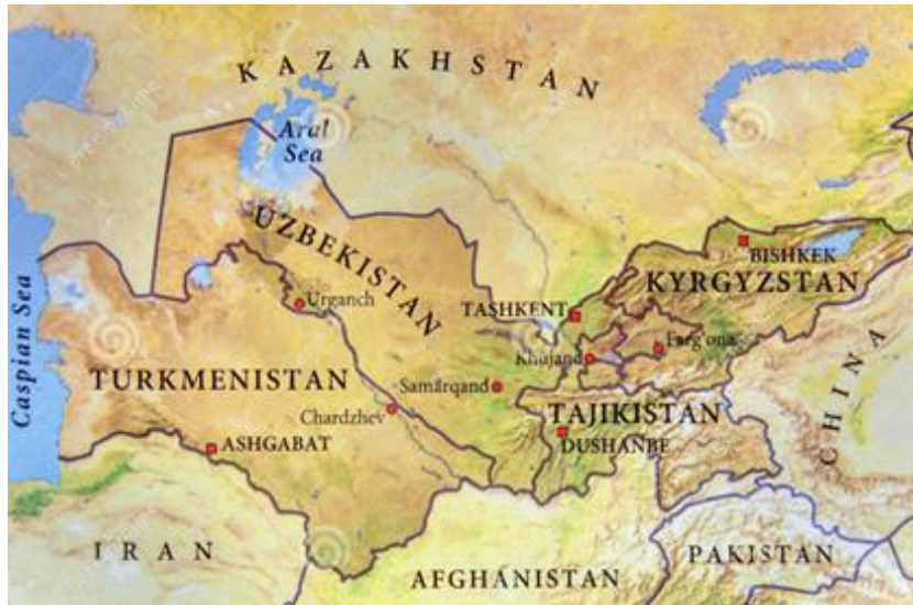
Fig. 5 Kirguistán - Tayikistán