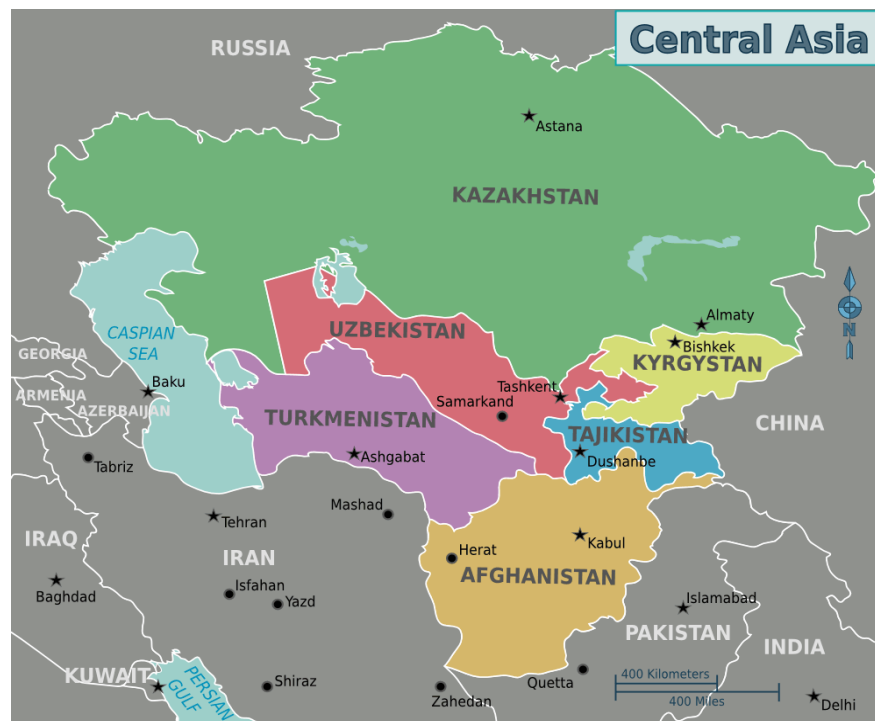
Fig. 4 Asia Central