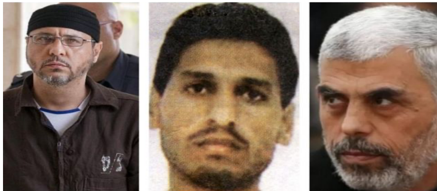
YAHYA IBRAHIM AL-SINWAR